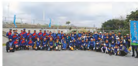
▲清掃活動集合写真