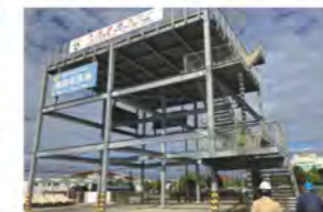
▲避難場所(避難タワー)