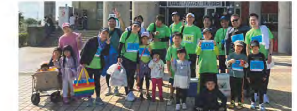
▲マラソン大会に参加した有志メンバー

全員が無事完走し、楽しく走った後は、沖縄そばやお楽しみ抽選会に参加しました。天気にも恵まれ、とても楽しいマラソン大会となりました。