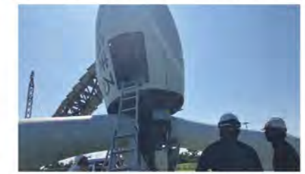
▲可倒式風力発電設備のナセル(回転部)の中を確認している様子

作業手順書に基づく安全帯の着装、適正工具の使用など、安全作業の徹底を確認することができました。これからも安全衛生の意識向上に取り組んでいきます。